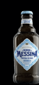
Cristalli di sale